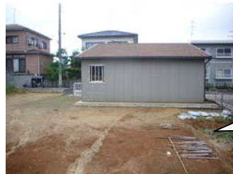
東南方向から見た様子